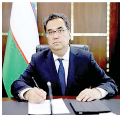
религии, личности и цивилизации». Узбекистан — родина великих ученых и мыслителей, внесших неоценимый вклад в развитие

Узбекистан стал центром проведения важнейших духовно-просветительских мероприятий. В августе прошел VIII международный конгресс «Наследие великих предков — фундамент третьего Ренессанса». В октябре в Ташкенте и Хиве состоялась авторитетная международная науч-