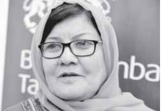
Дилбар НАЗАРИЙ, Афғонистон хотин-қизлар масалалари бўйича вазир:

Чунки давлат миқёсидаги ислохотларда аёлларнинг кенг иштирокини таъминлаш уларнинг жамият ҳаётида мустақам ўрин эгаллашларини кафолатлайди.