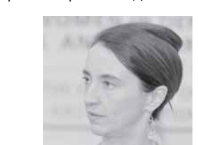
Мелани ВЕРВИР, ЕХТнинг гендер масалалари бўйича махсус вакили:

— Бундан 16 йил аввал Афғонистонда биронга қиз мактабга бормасди, умуман ўқитилмас эди. Бугун эса афғон қизларининг 40 фоизи таълим олмақда. Аёлларимизнинг ҳуқуқ ва манфаатларини таъминлаш, давлат бошқарувида улар фаоллигини ошириш Конституциямизда белгиланган бўлиши. Айни кунда бу борада қонун ва меъёрий ҳужжатлар ҳам ишлаб чиқилмоқда. Ҳозирги кунда 27 фоиз аёллар парламентда, 26 фоизи давлат олий ўқув юртларида ва 17 фоизи бошқа йўналишларда фаолият юритяпти. Гари Афғонистонда бу борада мавжуд муаммолар бўлишига қарамай, хотин-қизларнинг тенг ҳуқуқчилиги масаласини ҳал қилишга эришмоқдамиз.